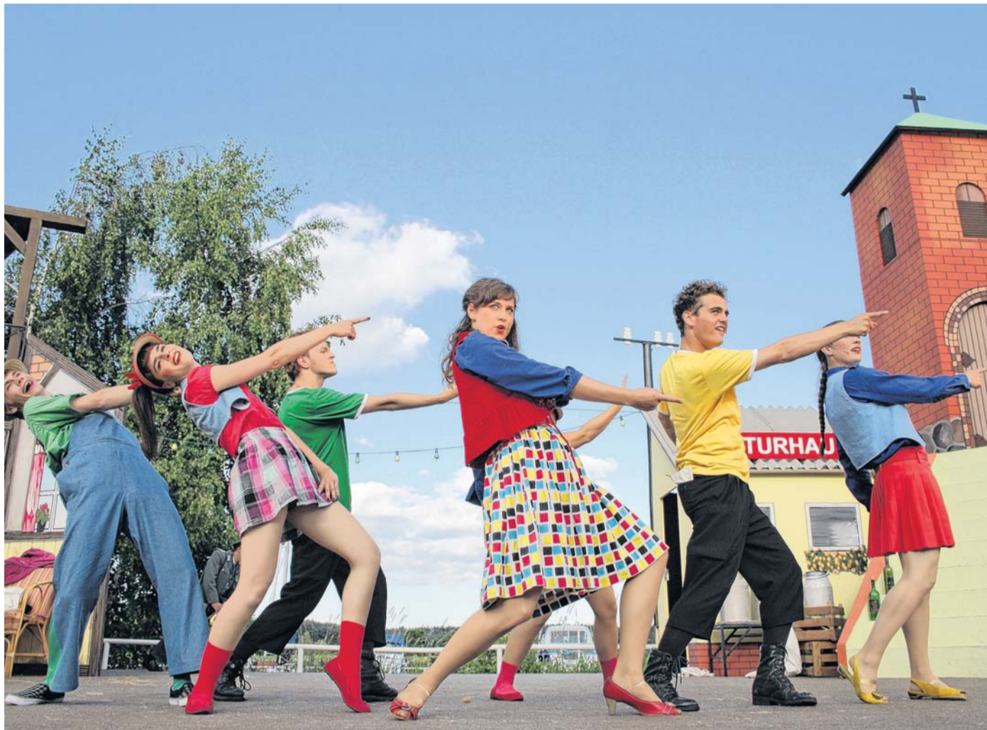
Die Theaterbusse der Verkehrsgesellschaft Vorpommern-Greifswald fahren im Sommer auch von Pasewalk zur Aufführung „Sonnenallee“ auf die Insel Usedom.

Unterdessen hat auch das Theater Vorpommern in Greifswald die Bewohner des